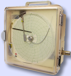
携帯型自記圧力計 SP-B

主な用途は、配管の気密検査におけるリークチェック(漏れ検査)など。 時間の経過とともに圧力が低下する様子が見られる場合、配管に欠陥がある事が分かります。